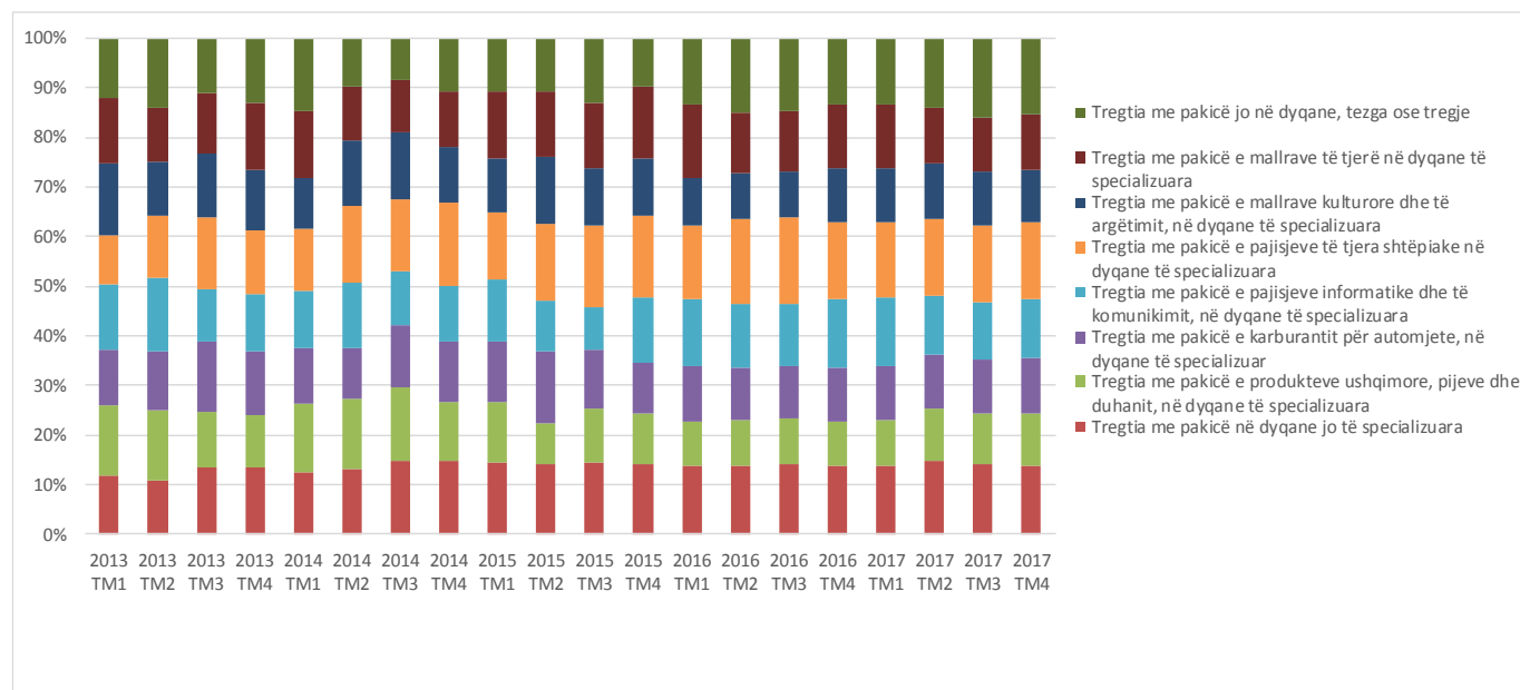
Figura 1. Indeksi i qarkullimit në sektorin e tregtisë me pakicë (2013=100)