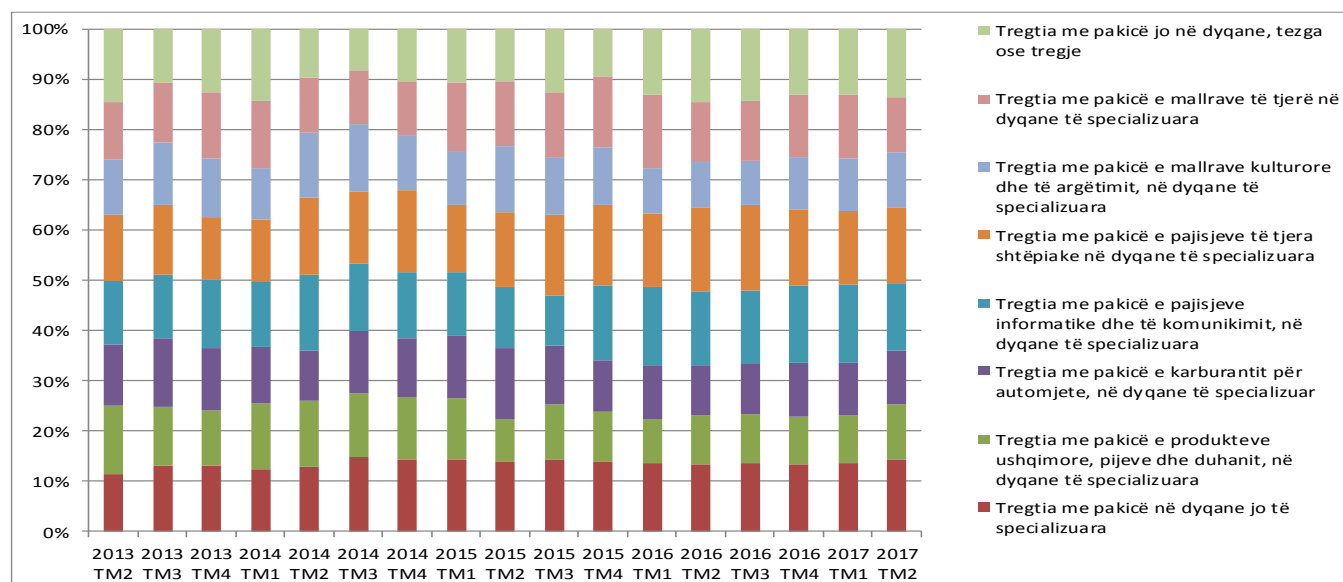
Figura 1. Indeksi i qarkullimit në sektorin e tregtisë me pakicë (2013=100)