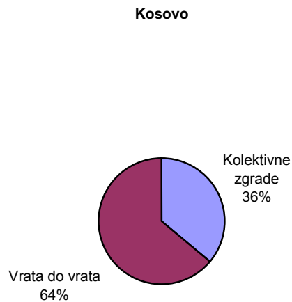
Grafikon 1: Struktura sakupljenog otpada u 2008.god.

Ukupna količina opštinskih otpadaka na Kosovu za 2008.godinu rezultira da je nešto preko 350 000 tona.