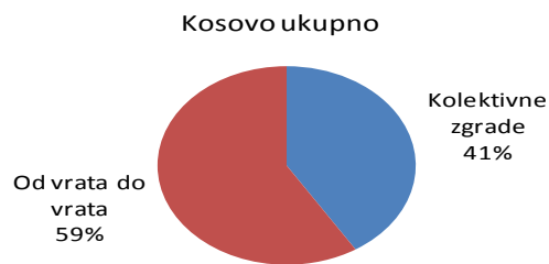
Grafikon 1: Struktura prikupljene količine komunalnog otpada u 2012 u %

Ukupna količina prikupljenog komunalnog otpada na Kosovu u 2012.godini je iznosila 606,983 tone. Na Kosovu Prikupljanje otpada od vrata do vrata je ostvareno 59%, dok u stambenim kolektivnim zgradama 41% (grafikon 1). Na drugim regionima na Kosovu, odnos prikupljanja komunalnog otpada bio je 42% u kolektivnim zgradama i 58% od vrata do vrata.