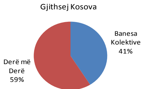
Grafiku 1: Struktura e mbeturinave komunale të grumbulluara në vitin 2012 në %

Gjithsej sasia e mbeturinave komunale të grumbulluara në Kosovë për vitin 2012, ka qenë 606, 983 ton. Në Kosovë grumbullimi i mbeturinave derë më derë ishte 59 për qind, ndërsa në banimin kolektiv ka qenë 41 për qind (grafiku 1). Në regjionet tjera në Kosovë grumbullimi i mbeturinave komunale ishte në raport 42 përqind në banim kolektiv dhe 58 për qind në banim derë më derë.