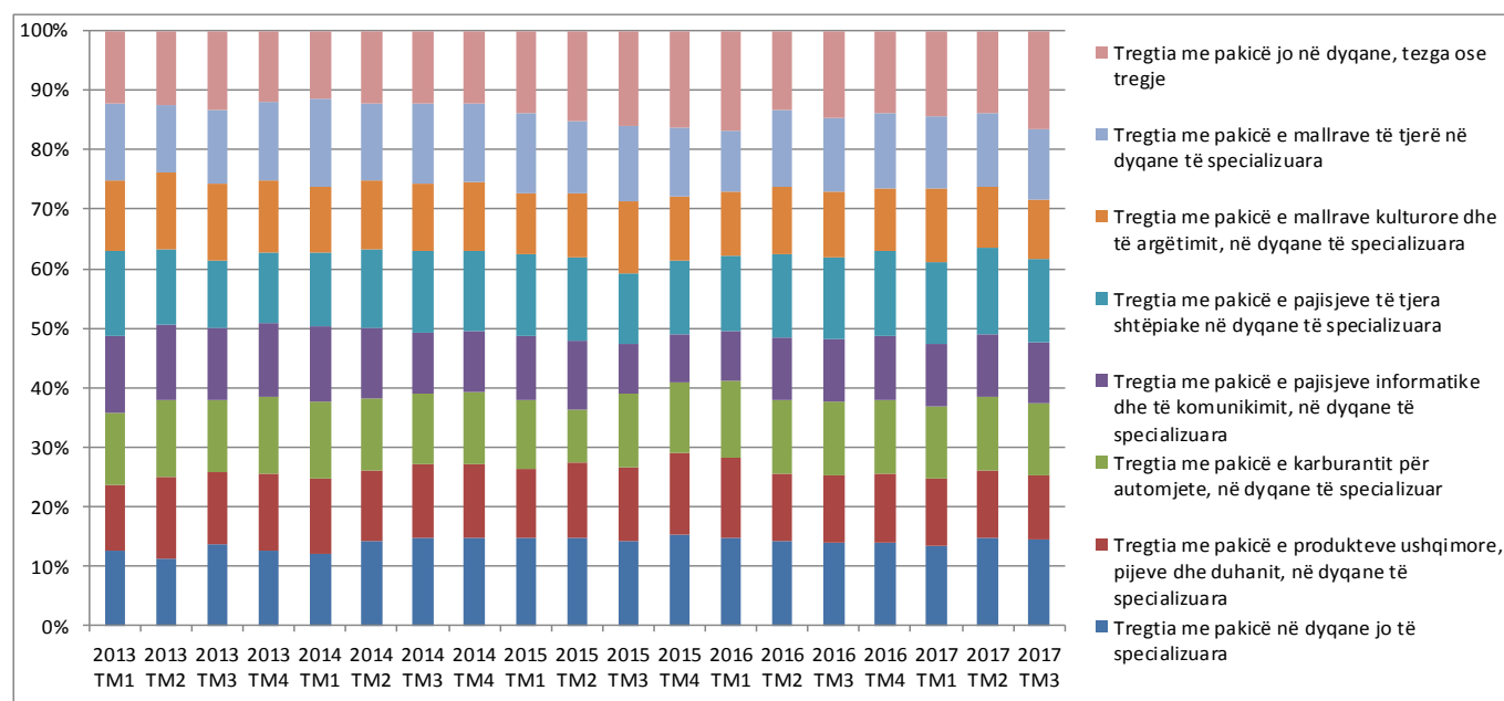
Figura 2. Numri i të punësuarve në sektorin e tregtisë me pakicë (2013=100)