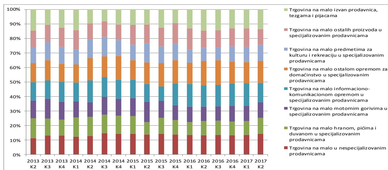
Slika 1. Indeks prometa u sektoru trgovine na malo (2013=100)