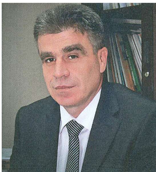
Kryeshefi i Agjencisë së Statistikave të Kosovës

Prandaj, për të gjithë shfrytëzuesit e të dhënave, këto janë të dhënat e fundit zyrtare, të vlerësuara për numrin e popullsisë së Kosovës në nivel të komunave për vitin 2013.