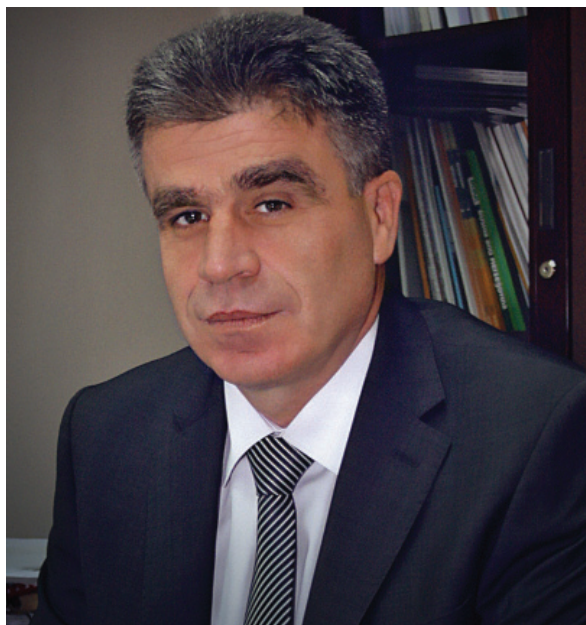
Izvršni direktor Agencije statistike Kosova

na nivou opština za 2011. godinu. Naredna procena (za 2012. godinu) će biti izvršena do sredine 2013. godine.