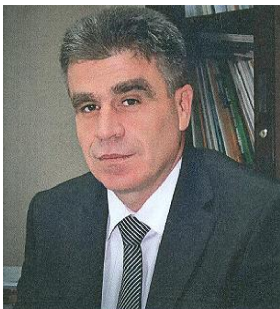
Kryeshefi i Agjencisë së Statistikave të Kosovës

Shfrytëzuesit e te dhënave duhet te marrin parasysh shpjegimet metodologjike të cilat janë më se të nevojshme për kuptimin dhe interpretimin e drejtë të të dhënave.