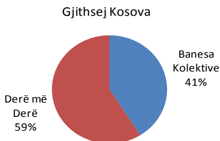
Grafiku 1: Struktura e mbeturinave komunale të grumbulluara në vitin 2012 në %

Gjithsej sasia e mbeturinave komunale të grumbulluara në Kosovë për vitin 2012, ka qenë 606, 983 ton. Në Kosovë grumbullimi i mbeturinave derë më derë ishte 59 për qind, ndërsa në banimin kolektiv ka qenë 41 për qind (grafiku 1). Në regjionet tjera në Kosovë grumbullimi i mbeturinave komunale ishte në raport 42 përqind në banim kolektiv dhe 58 për qind në banim derë më derë.